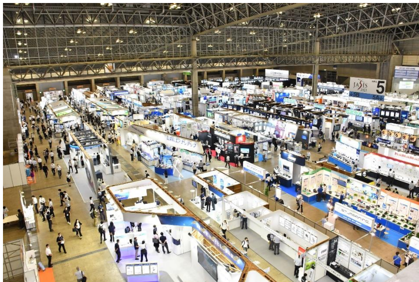
JASIS 2022 展示会場 1