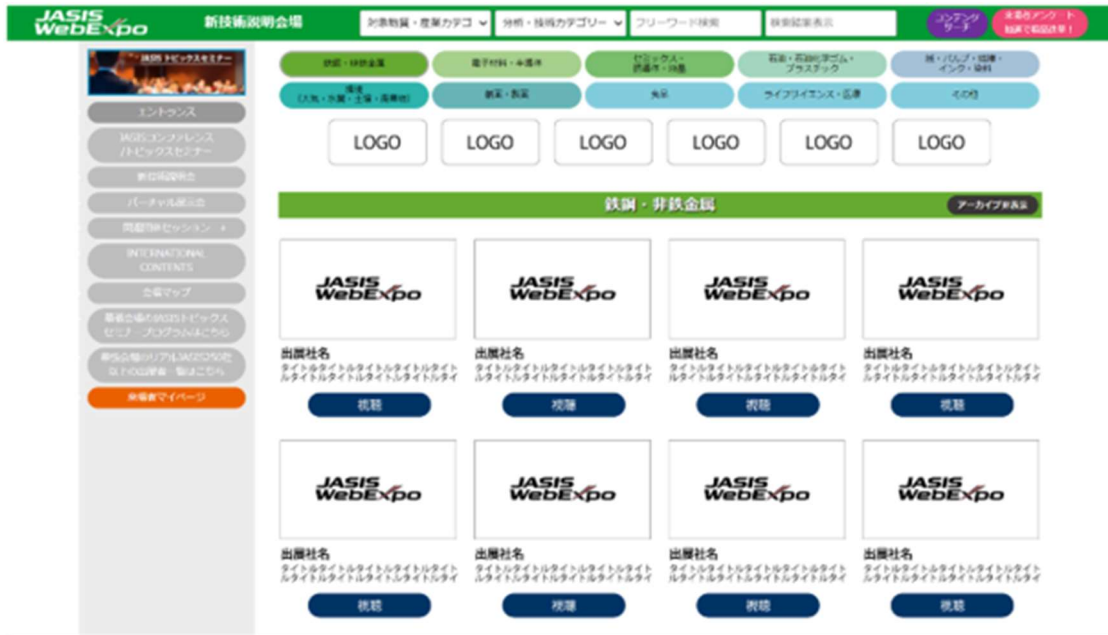
出展社の動画サムネイル一覧

新技術説明会の会場(ページ)は、目的のセッションにスムーズにたどり着けるよう、出展社の動画サムネイルを一覧で表示し、視認性と操作性を高めた作りとなっています。