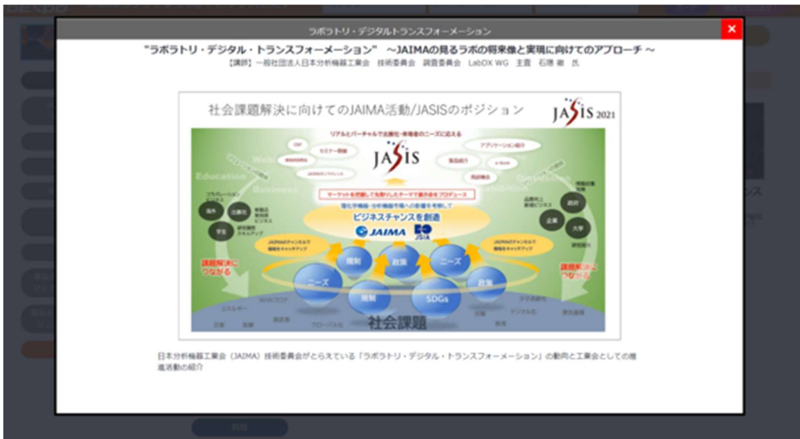
動画は別ページに遷移することなく閲覧可能

展示会場では、約 320 の企業・機関がコンテンツを掲載します。また、2021 年と同様、JASIS の人気講演会・セミナーの動画を掲載します。これらは、来場者は期間中、Web 上で自由に閲覧できます。